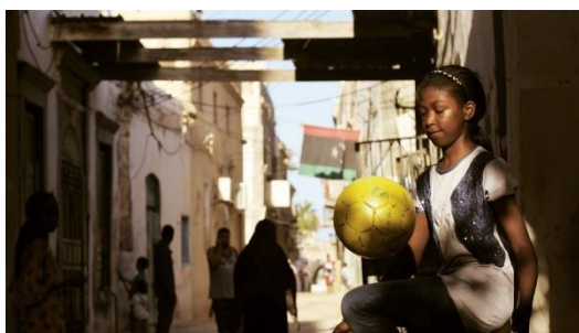
Paradise Without People, de Francesca Trianni