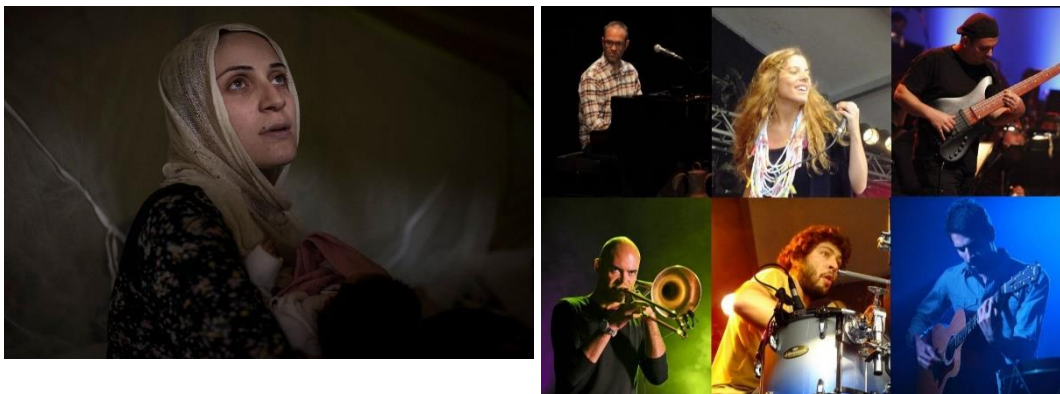
Finding Home, Lynsey Addario, Revista TIME

Em 2019, a variedade e a vitalidade do cinema mediterrânico está espelhada nos temas que atravessam a programação de Olhares do Mediterrâneo - Women's Film Festival , que abarcam desde o corpo das mulheres e a sua expressão, aos direitos e igualdade de género e às relações familiares e afectos; dos diferentes espaços em que habitamos no mundo de hoje, às migrações e deslocações em busca de refúgio.