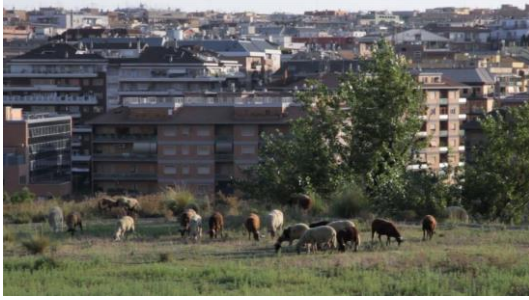
Via San Cipriano | Lea Schlude | Itália, Alemanha | doc | 2019